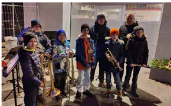
Die musikalische Umrahmung übernahmen unsere Nachwuchsmusiker und ein Quintett der Trachtenmusik.