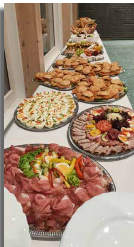
Der Proberaum war zwar noch nicht ganz fertig, bot aber schon eine gute Möglichkeit für unsere Versammlung und das anschließende Buffet.